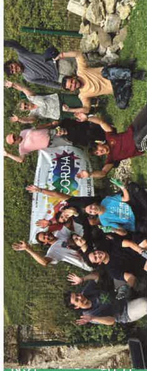
Les volontaires du chantier international avec l'association Fort Cap d'Alprech

Engagez les jeunes de votre territoire dans la construction d'une citoyenneté européenne ! Par le biais du Corps Européen de la Solidarité ou des projets Erasmus+ (Échanges de Jeunes ou Formations Européennes), ouvrez vos portes à de jeunes européens-ne-s