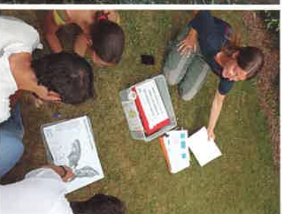
Les volontaires internationaux-ales de St-Quentin